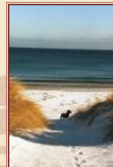
Sandstrand an der "Schaabe"