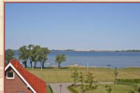
Blick auf den Wieker Bodden

Vom Wieker Hafen ist es möglich, einen Ausflug zur benachbarten Insel Hiddensee zu unternehmen. Vom Breeger Hafen, der nur wenige Minuten von Wiek entfernt ist, haben Sie die Möglichkeit, mit dem Schiff zu den Störtebekerfestspielen nach Ralswiek zu fahren. Der längste Sandstrand der Insel zwischen Glowe und Juliusruh ist ebenfalls nur einige Kilometer entfernt. Mehr verraten wir an dieser Stelle nicht, besuchen Sie uns einfach und entdecken unsere wunderschöne Insel selbst.